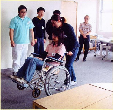
外出介護従業者養成講座 ガイドヘルパー